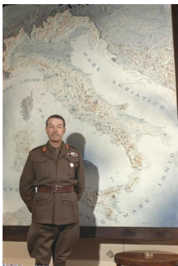
Верховный Главнокомандующий союзными войсками в Средиземном море генерал Гарольд Александер.

Участие в ней приняла 15-я Группа Армий под командованием генерала сэра Гарольда Александера 1 .