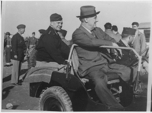
Генерал Бернард Монтомери и генерал-лейтенант Джордж Паттон на Сицилии.