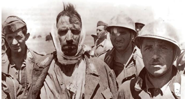
Пленные итальянские солдаты из 206-й дивизии береговой обороны.

В ходе операции потери союзников убитыми, пропавшими без вести, ранеными и пленными составили: 8,8 тысяч человек у американцев, 11,8 тысяч у британцев и 2,3 тысячи у канадцев. Потери войск стран Оси были значительно больше: 27,9 тысяч у немцев, включая 5,5 тысяч пленных, и около 147 тысяч у итальянцев, из которых 116,7 тысяч пленными.