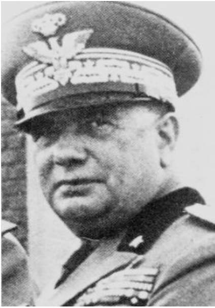
Президент Франклин Рузвельт, генерал Эйзенхауэр и генерал Паттон в Кастельветрано Сицилия.

Целью операции был разгром итало-немецких войск, находящихся на острове; обеспечение безопасного судоходства союзников в Средиземном море; а также оказание давления на фашистское правительство Бенито Муссолини для возможного